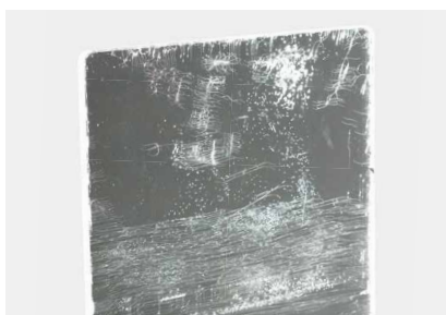
Szyba akrylowa umyta przy użyciu konwencjonalnych preparatów do szkła lub środków na bazie alkoholu

Tworzące się pęknięcia naprężeniowe skracają żywotność szyby.