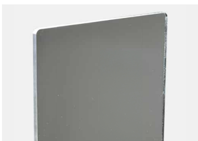
Szyba akrylowa umyta środkiem Acrylstar

Tworzące się pęknięcia naprężeniowe skracają żywotność szyby.