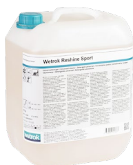
Wetrok Reshine Sport