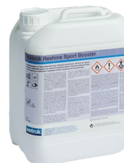
Wetrok Reshine Sport Booster